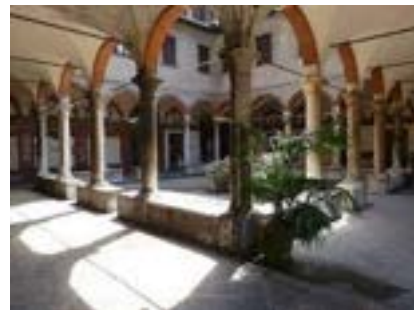
Lo stupendo chiostro del Teatro Fontana a Milano

Il Teatro Fontana di Milano; Il Teatro Cantiere Florida di Firenze; Il Teatro Testori di Forlì.