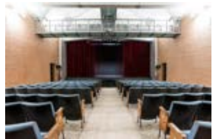
Il Teatro Testori a Forlì

In ciascuno di questi Teatri ha svolto le seguenti attività: